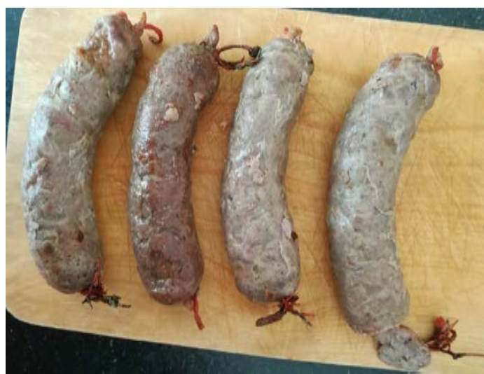
а) б) в) г)