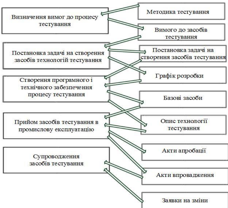
Рис. 1. Граф взаємодії в процесі підготовки засобів тестування

На рис. 1 і 2 показано графи взаємодії в процесах підготовки засобів тестування та розробки тестів як приклади детального виконання задач табл. 1.