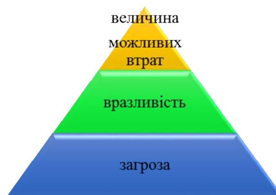
Рисунок 2 – Фактори оцінювання інформаційних ризиків

кретного інформаційного активу досить важко (рисунок 2).